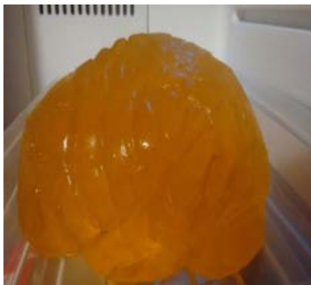
Fig. 2. Tejidos blandos cerebrales en bases a una mezcla de gelatina.

En este molde de cerebro de silicona, se vertió la mezcla, que posee 170 ml de agua, 50 ml de glicerina, 100 gr gelatina en polvo y 5 gr de gelatina en hojas, y luego se dejó reposar en el refrigerador a una temperatura de 5,5 °C, para dejar que la solución adquiriera su consistencia tipo gel. (Ver Figura 2).