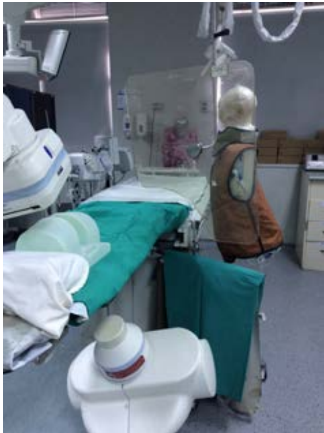
Fig. 1. Ubicación de maniqués dentro del pabellón de Hemodinamia.

todo el aditamento de protección radiológica habitual que utiliza el TOE, los cuales son mostrados en la Figura 1.